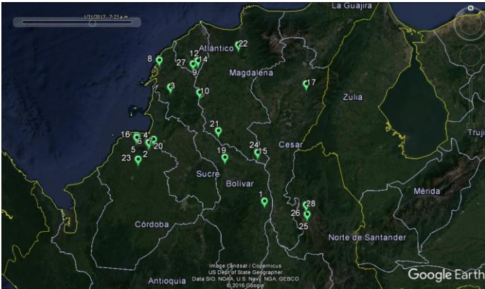
Figura 1. Distribución geográfica de los focos de PPC en el 2016

En el 2016 se presentaron 28 focos de Peste Porcina Clásica en el territorio nacional , de los cuales 4 focos se presentaron en el departamento del Atlántico en los municipios de Campo de la Cruz (3) y Santa Lucía (1), 4 focos en el departamento de Bolívar distribuidos en los municipios de Cartagena (1), María la Baja (1), Morales (1) y Pinillos (1), 1 foco en el municipio de Agustín Codazzi en el Cesar ; 11 focos en el departamento del Córdoba en los municipios de Cereté (1), Chima (5), Lorica (4) y Tuchín (1), 3 focos en el departamento de Norte de Santander en los municipios de Abrego (2) y La Playa (1) y 5 focos en el departamento de Magdalena en los municipios de El Banco (2), El Retén (1) y Tenerife (1). (Figura 1 y 2).