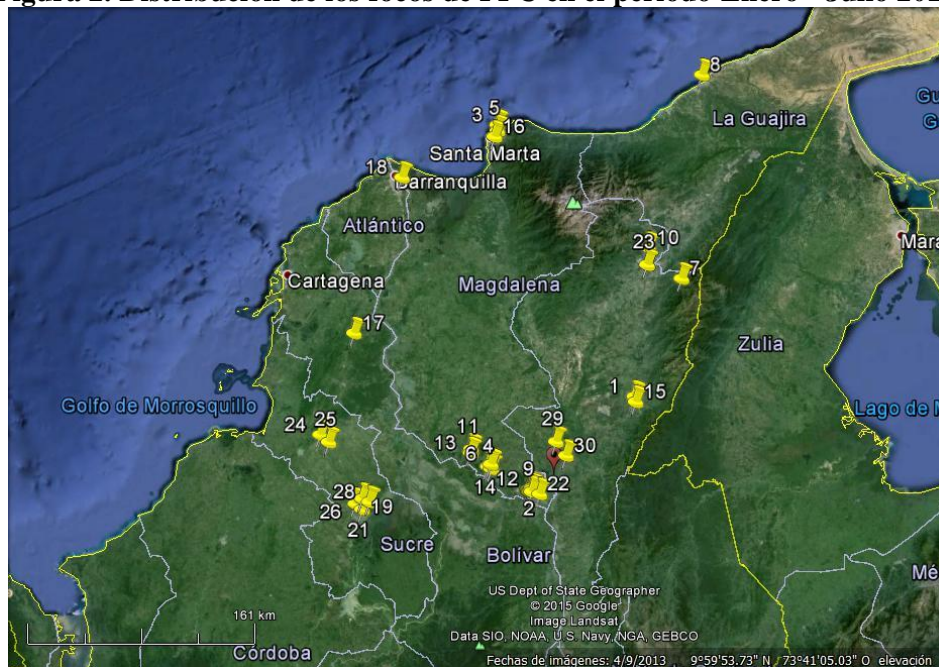
Figura 2. Distribución de los focos de PPC en el periodo Enero - Julio 2015.

En relación a la temporalidad de los focos de PPC, en el periodo 2015 se ha observado que se tiene un pico de presentación de la enfermedad en los meses de enero a abril, lo cual está relacionado con los ciclos de vacunación que culminan en noviembre e inician en febrero y con los periodos de interbarrido donde se vacunan menos animales, así como a la poca disponibilidad de vacuna por problemas en la importación de la misma entre 2014 y 2015. (Figura 3)